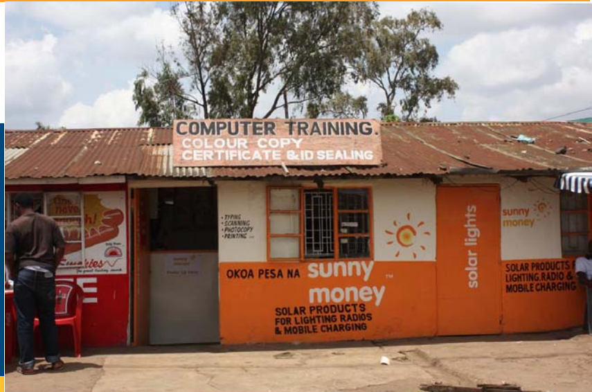
Computer- und Internetcafé in Nairobi, Kenia